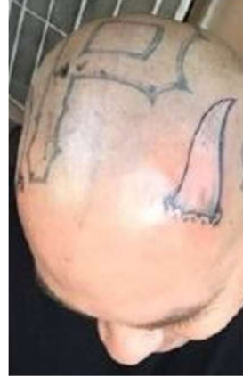
Tatuaje en la parte superior de la cabeza