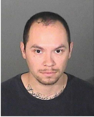
Fotografía tomada en 2016

Se dio a la fuga para evadir el proceso judicial — Asesinato