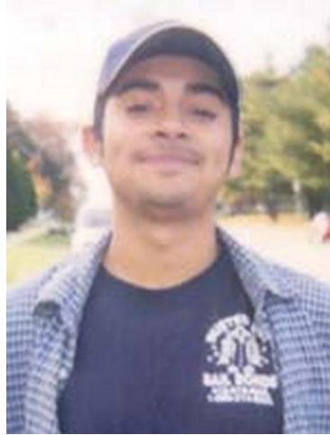
Fotografía tomada en 2005