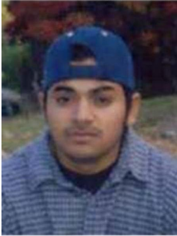
Fotografía tomada en 2005

Se dio a la fuga para evadir el proceso judicial – Asesinato en primer grado (dos cargos)