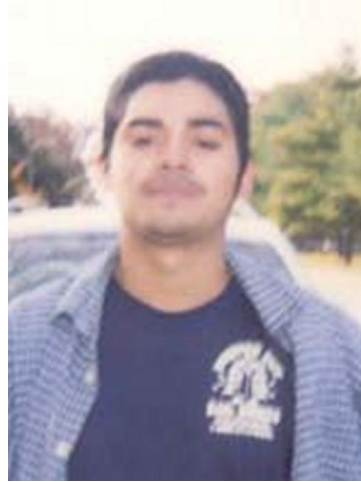
Fotografía tomada en 2005