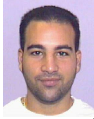
ألتقطت الصورة حوالي عام 2008