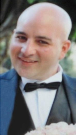
ألتقطت الصورة عام 2013

التآمر لأرتكاب غسل الأموال، التآمر لأرتكاب الأحتيال المصرفي، غسل الأموال (21 تهمة) والتعامل في ممتلكات تم التحصل عليها بطريقة إجرامية (18 تهمة)