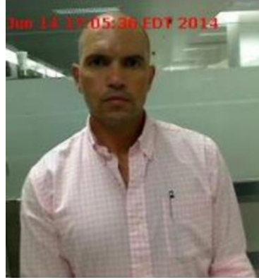
Fotografía tomada en 2014