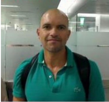
Fotografía tomada en 2014