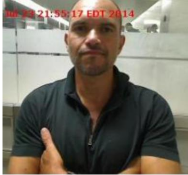
Fotografía tomada en 2014