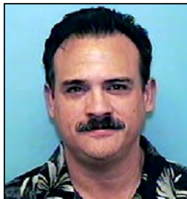
Fotografie z roku 2009