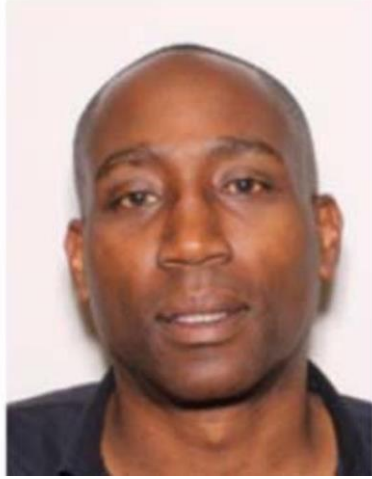
صورة التقطت في عام 2022