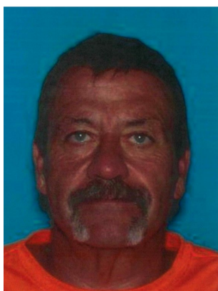
Fotografía tomada en 2020