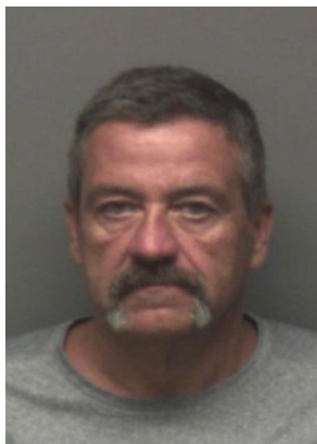
Fotografía tomada en 2021

Trata de menores de edad con fines de explotación sexual