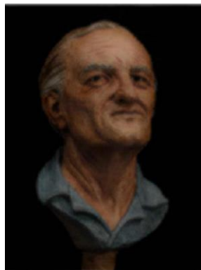
Busto que muestra progresión de edad a 77 años

Se dio a la fuga para evadir el proceso judicial – Asesinato con arma contundente