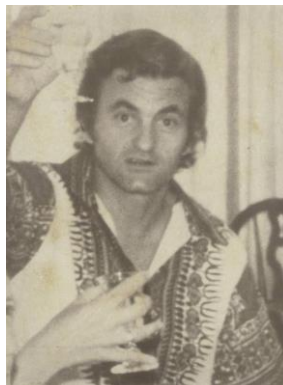
Fotografía tomada de entre 1970 y 1975