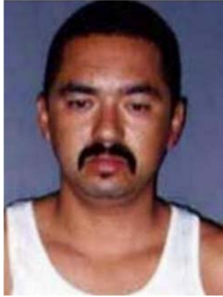
Fotografía tomada en 1998

Se dio a la fuga para evadir el proceso judicial – Asesinato