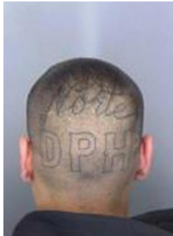
Tatuajes en la parte posterior de la cabeza