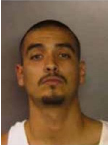
Fotografía tomada en abril de 2007

Se dio a la fuga para evadir el proceso judicial – Homicidio