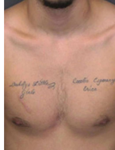
Tatuajes y cicatriz en el pecho