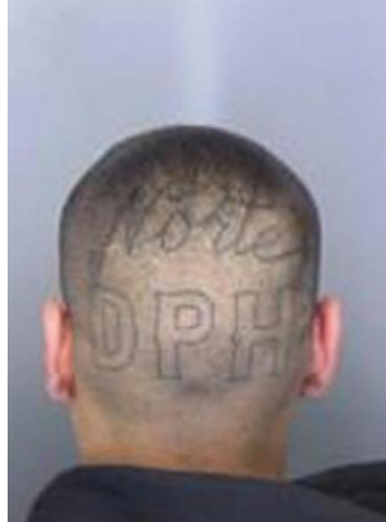
Tatuajes en la parte posterior de la cabeza