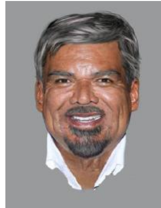
Imagen que muestra progresión de edad a 64 años