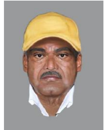
Imagen que muestra progresión de edad a 64 años