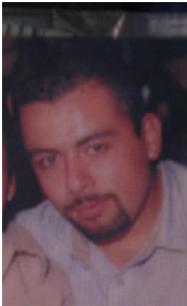
Fotografía tomada en 2006

Se dio a la fuga para evadir el proceso judicial – Asesinato