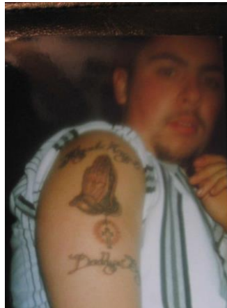
Fotografía tomada en 1999