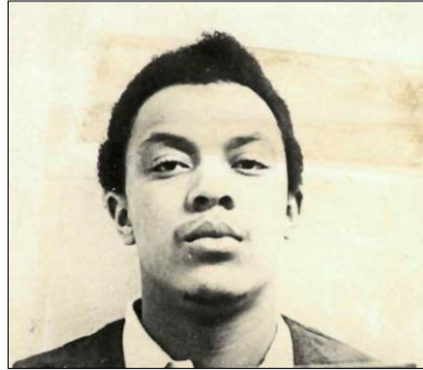
Imagen obtenida en 1971