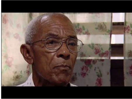
Imagen obtenida en 2015

Se dio a la fuga para evadir el proceso judicial – Asesinato; piratería aérea, secuestro