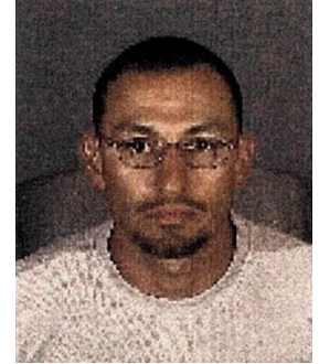
Fotografía tomada en 2006