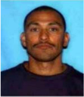
Fotografía tomada en 2004

Se dio a la fuga para evadir el proceso judicial – Asesinato; tentativa de asesinato; agresión con arma mortífera