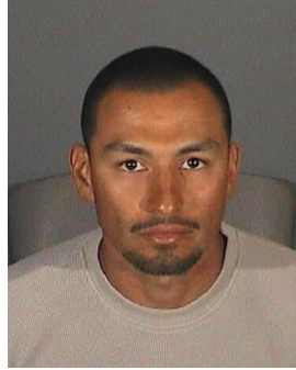
Fotografía tomada en 2006