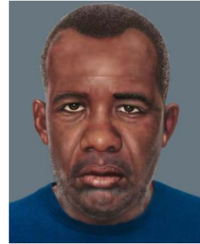
Fotografía que muestra progresión de edad a 50 años