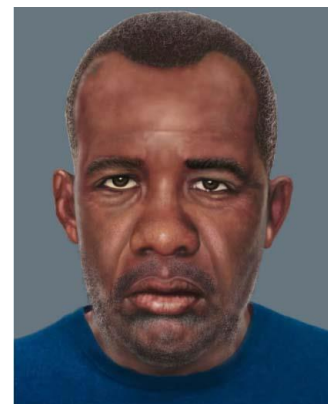
Photo montrant simulation de vieillissement, 50 ans