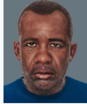
Foto laj pwogrese a 50 ane fin vye granmoun