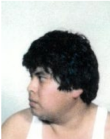
Fotografía tomada en mayo de 1989