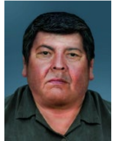
Fotografía que muestra progresión de edad