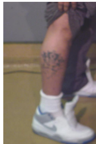
Tatuaje en la pierna derecha