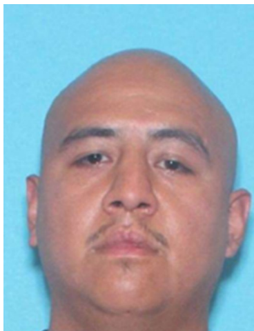
Fotografía tomada en 2022