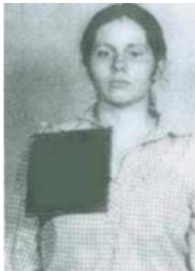
Fotografía tomada en 1981

Se dio a la fuga para evadir el proceso judicial – Disturbio, ataque contra un agente policial