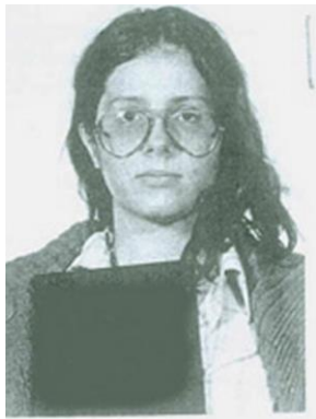
Fotografía tomada en 1981