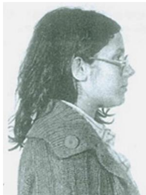
Fotografía tomada en 1981