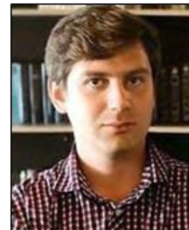
ПЕТРО МИКОЛАЙОВИЧ ПЛІСКІН