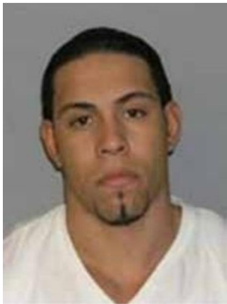
Fotografía tomada en diciembre de 2012

Incumplimiento de los términos y condiciones de la libertad bajo fianza; conspiración de narcotráfico