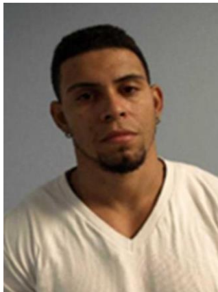
Fotografía tomada en marzo de 2012