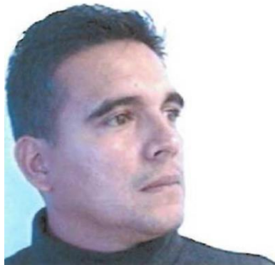
Fotografía de fecha desconocida