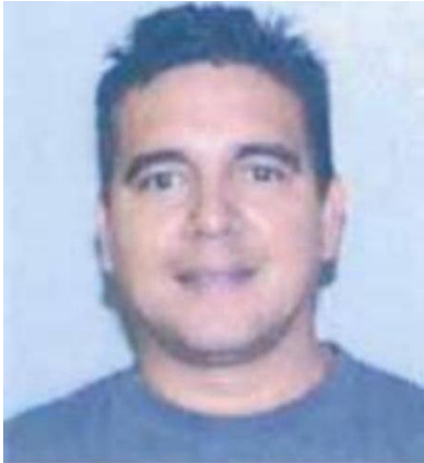
Fotografía tomada en 2005

Se dio a la fuga para evadir el proceso judicial – Abandono de la escena de un accidente de navegación donde alguien resultó herido y/o muerto, navegación bajo los efectos del alcohol o de droga-homicidio involuntario