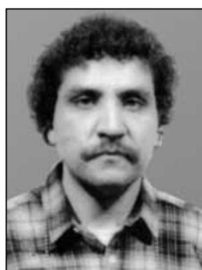
Fotografía sacada en 1980