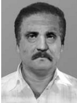
Fotografía modificada en 2005 para mostrar progresión de edad