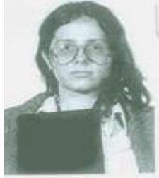
Fotografía tomada en 1981