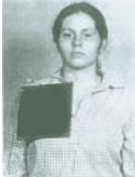
Fotografía tomada en 1981