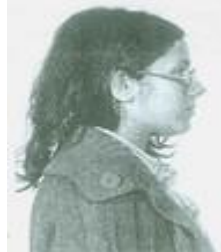
Fotografía tomada en 1981